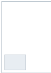
1/8 Seite im Satzspiegel 90 mm × 64 mm € 320,-