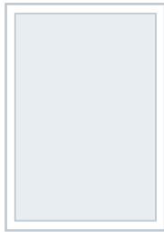
1/1 Seite im Satzspiegel 185 mm × 271 mm € 1.700,-