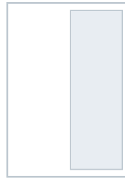
1/2 Seite hoch im Satzspiegel 90 mm × 271 mm € 2.100,-