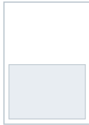
1/2 Seite quer im Satzspiegel 185 mm × 133 mm € 2.100,-