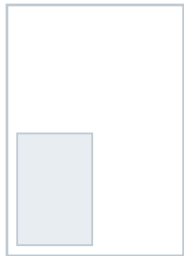
1/4 Seite 2-spaltig im Satzspiegel 90 mm × 133 mm € 1.100,-